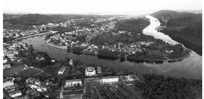
Hình 2.2. Tiên Yên - vùng đất ngã ba sông - huyện có 2 con sông lớn là Tiên Yên và Phó Cú, hợp nhau tại đầu thị trấn Tiên Yên, đổ ra cửa biển Mũi Chùa.