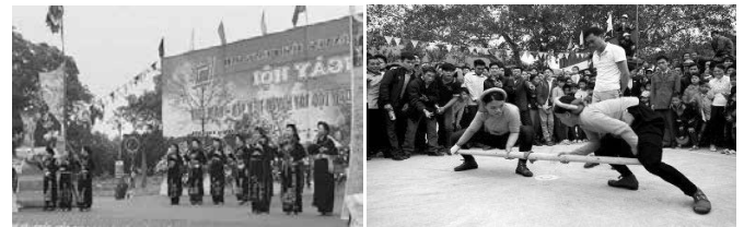
Hình 2.6. Giao lưu hát then - đàn tính- dân tộc Tày - thôn Đông Đình - Phong Dụ (trái); Các trò chơi dân gian tại Lễ hội dân tộc Sán Chỉ [7] (phải)

Những giá trị văn hóa dân gian ẩn chứa trong điệu hát, tiếng khèn, trong trang phục truyền thống chính là sợi chỉ gắn kết đa sắc màu văn hóa dân tộc, làm nên nét riêng, khác biệt của Tiên Yên. Đây cũng chính là những giá trị đặc trưng- là lợi thế của Tiên Yên trong quá trình phát triển bền vững.