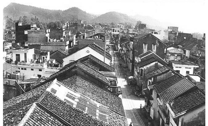
Hình 2.5. Phố cổ Tiên Yên với rất nhiều công trình kiến trúc Pháp và Hoa cổ được xây dựng từ khoảng đầu thế kỷ 20, theo cấu trúc nhà ống, hai tầng, mái ngói đất nung lợp theo kiểu âm dương

Sự đa dạng về văn hóa còn mang lại cho nơi đây hệ thống các di sản văn hóa phi vật thể với nhiều loại hình khác nhau như: Trang phục, ngôn ngữ, phong tục, tập quán, nghề thủ công truyền thống... góp phần tạo nên cho Tiên Yên nguồn tài nguyên du lịch nhân văn giàu giá trị. Bao gồm 6 loại hình trình diễn nghệ thuật dân gian; 21 loại hình tập quán xã hội; 14 loại hình tri thức dân gian; 4 loại hình nghề thủ công truyền thống; 5 loại hình lễ hội. Các lễ hội truyền thống, trò chơi dân gian, phong tục như: Lễ hội lồng tồng của dân tộc Tày, lễ hội cấp sắc của đồng bào Dao, lễ hội cầu mùa của dân tộc Sán Chỉ, lễ hội đua thuyền truyền thống của xã Đông Rui, lễ đại phan của dân tộc Sán Diu... các làn điệu dân ca (hát then và đàn tính của dân tộc Tày, hát soóng cọ của dân tộc Sán Chỉ, hát đối của dân tộc Dao Thanh Y, Dao Thanh Phán...)