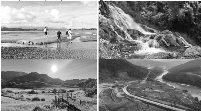
Hình 2.4. Mũi Lông Vàng - Thác Pác Súi - ruộng bậc thang Đại Dục

Tiên Yên không chỉ là mảnh đất có nhiều lợi thế về vị trí, tài nguyên thiên nhiên phong phú, mà còn mang trong mình nhiều giá trị lịch sử giàu có. Theo đánh giá của các nhà khảo cổ và qua các di chỉ khai quật được, quá trình di cư tới những vùng đồng bằng, ven sông, người Việt cổ đã chọn nơi này để sinh sống và phát triển. Do vậy, Tiên Yên còn có một hệ thống các giá trị văn hóa vật thể và phi vật thể vô cùng đặc sắc.