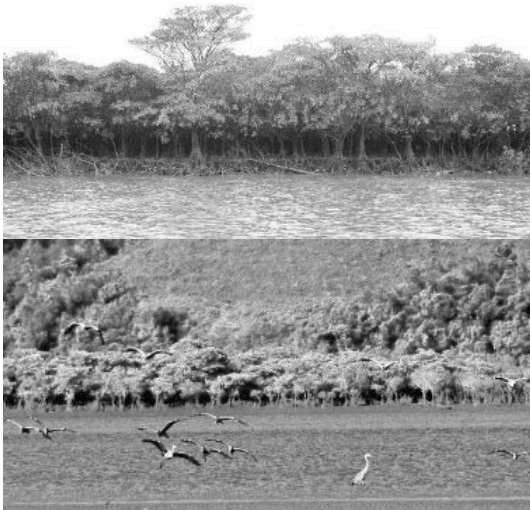
Hình 2.3. Đông Rui - với trên 2.800ha rừng ngập mặn, đa dạng về sinh học, là lá phổi xanh bảo vệ môi trường và là điều kiện để phát triển mạnh mô hình du lịch sinh thái [7]

Tiên Yên không chỉ là mảnh đất có nhiều lợi thế về vị trí, tài nguyên thiên nhiên phong phú, mà còn mang trong mình nhiều giá trị lịch sử giàu có. Theo đánh giá của các nhà khảo cổ và qua các di chỉ khai quật được, quá trình di cư tới những vùng đồng bằng, ven sông, người Việt cổ đã chọn nơi này để sinh sống và phát triển. Do vậy, Tiên Yên còn có một hệ thống các giá trị văn hóa vật thể và phi vật thể vô cùng đặc sắc.