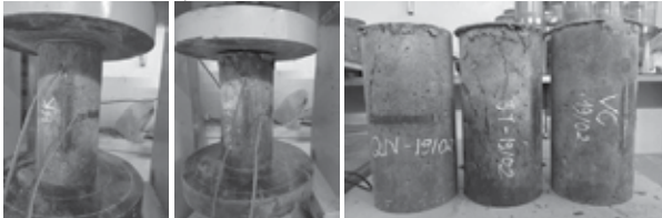
Hình 3. Thí nghiệm ứng suất nén - biến dạng mẫu UHPC